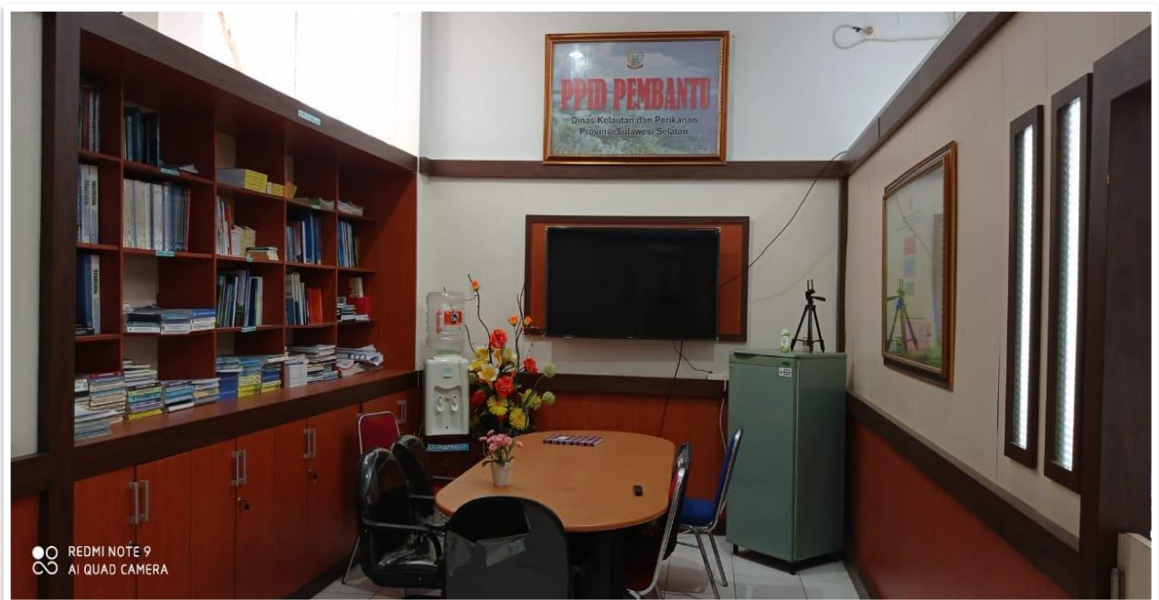
Gambar 4. Ruang PPID Pembantu Dinas Kelautan dan Perikanan Provinsi Sulawesi Selatan