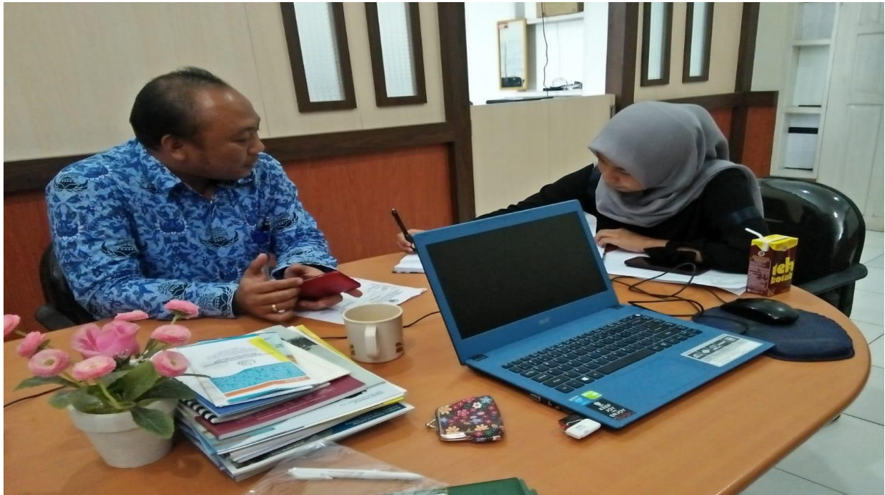
Gambar 5. Pelayanan Informasi Kepada Wartawan SINDO