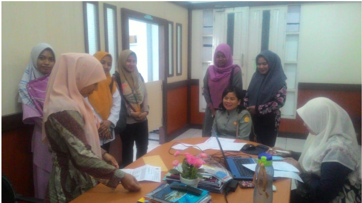
Gambar 6. Pelayanan terkait Permintaan data dari Mahasiswa S2 UNHAS