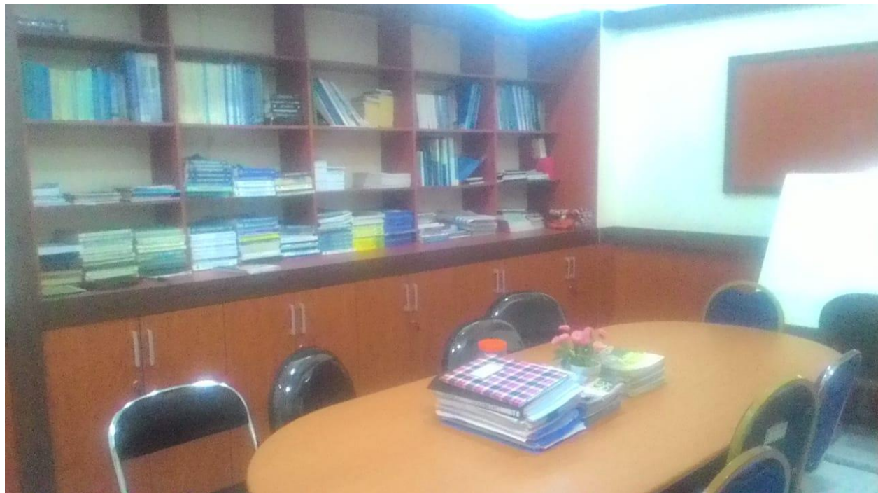
Gambar 4. Ruang PPID Pembantu Dinas Kelautan dan Perikanan Provinsi Sulawesi Selatan